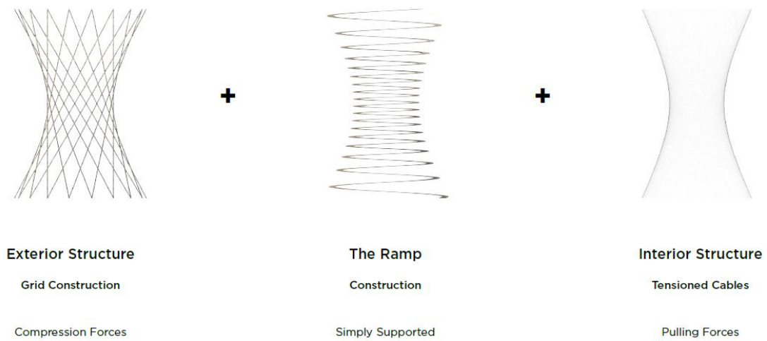
Figur 1: Studier af maksimering af oplevelse