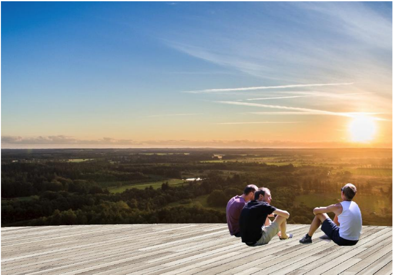
Figur 4: Bud på scenarier fra toppen