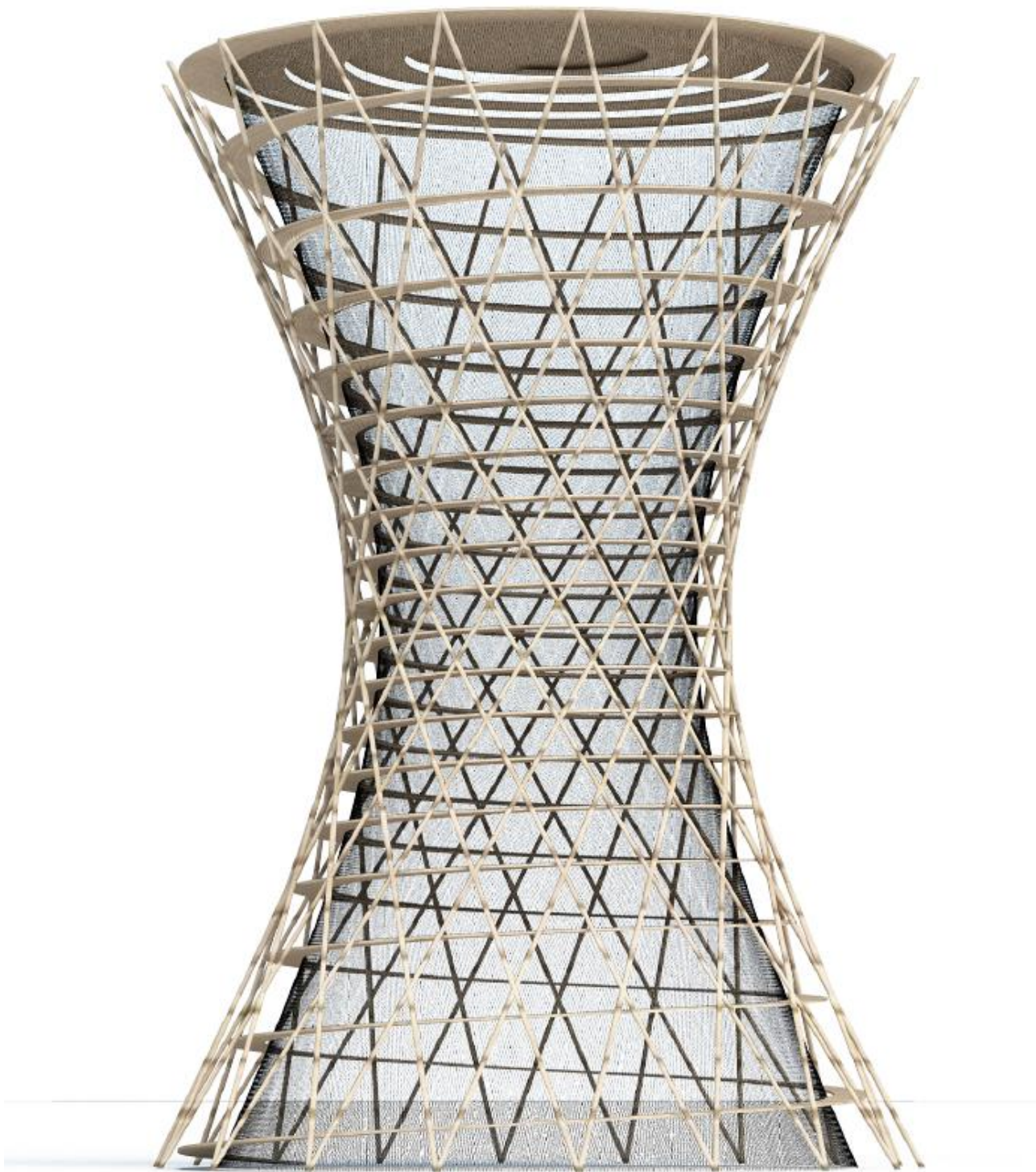
Figur 3: Bud på udtryk