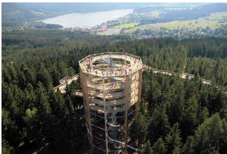
Tårn i Lipno, Tjekkiet'. Lignende tårn opført i Tjekkiet, som har givet inspiration til projektet.