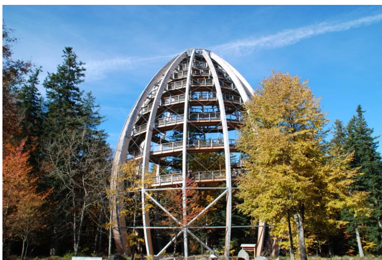
'Tårn i Bayern'. Lignende tårn opført i Bayern, som har givet inspiration til projektet.

Med sin størrelse og unikke udformning. Kan tårnet blive en markør og fyrtårn for hele Sydsjælland og vil tiltrække meget opmærksomhed, skabe arbejdspladser og spin-of effekter til det resterende turisterhverv.